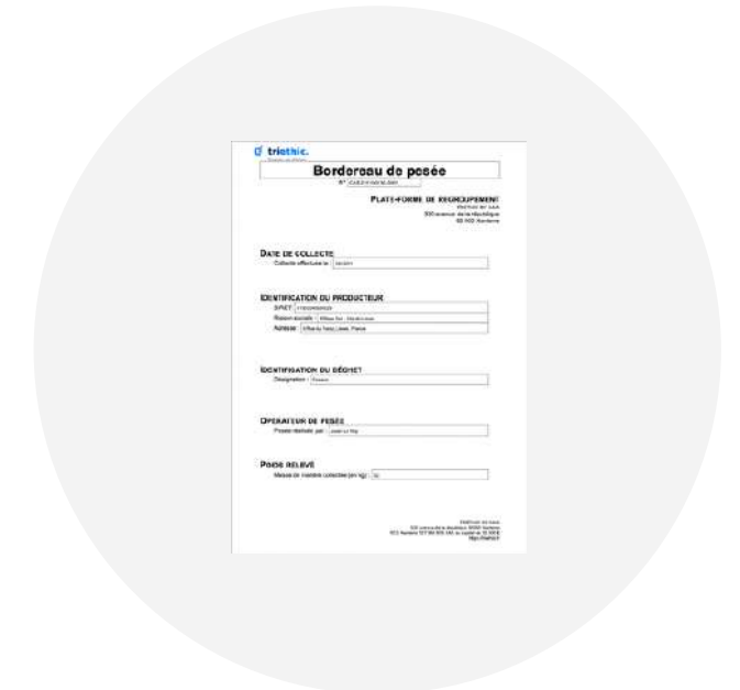
Bordereau de pesée