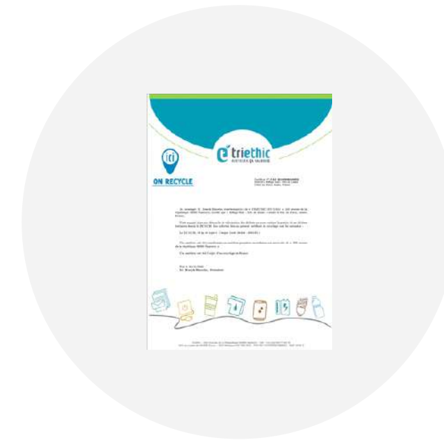
Bordereau de recyclage